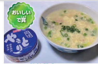
簡単親子スープ たまごをわつたり、かき混ぜたり、ねぎを切ったり、全部が楽しかったです。スープもとてもおいしいです。

寸評 簡単に作れるのがいいですね。焼き鳥缶以外の缶詰を使って、アレンジスープがいろいろとできますね。