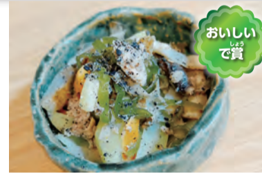
まごはやさしいツナとゆかいな仲間たち 何を作るか、どういうふうにしたらおいしい料理になるかを考えました。楽しかったです。

寸評 根菜のごぼう・にんじん、乾物の干し椎茸・高野豆腐と缶詰のツナで、バランスのいい料理です。いろんな食材を使い、缶詰の特性をいかしたレシピですね。