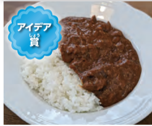
イワシカレー 想像していたよりうまくできたので今度はおばあちゃんに作ってあげたいです。包丁を使わなかったのが安全で良かったです。

寸評 災害時には冷蔵庫など電化製品が使えないことが前提。イワシ水煮缶の出汁が効いている本格カレーです。災害時にいいレシピですね。