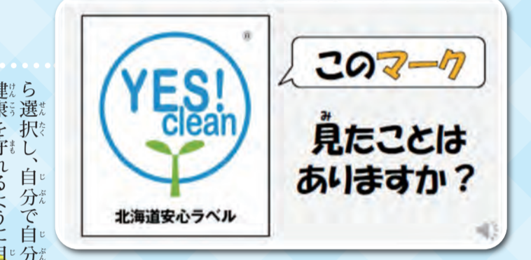
食育放送「食べて、知ろう! YES! clean農産物」