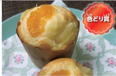
フルーツミックス☆マフィン 混ぜるのが大変で手が痛くなったけど、簡単です。焼きたてのマフィンはフルーツがジャムみたいですよ。

寸評 缶詰を上手に使って、マフィンのおいしさが倍増。おしゃれに仕上がっています。クッキーやパンケーキなどにも応用ができますね。