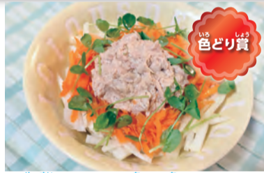
野菜とツナの盛り盛りサラダ にんじんしりしりを作るのがおもしろかったです。ツナマヨをまぜて楽しかったです。ごま油をかけるといい匂いしました。

寸評 災害時に火を使わずにできる料理はいいですね。低学年もチャレンジできる料理になっています。