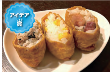
缶詰でいなり寿司3種 いなり寿司が好きで、お寿司屋さんでいつも注文します。メニューを考えたときにいなり寿司にしようと思いました。受賞して嬉しいです。

寸評 手早く、手軽に、いなり寿司が3種もできるのがいいですね。災害時にも、味付きの揚げがあると、簡単にできるのがいいですね。