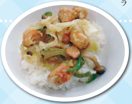
給食メニュー:「鮭のちゃんちゃん焼き丼」

るメリットがあります。指導に関しては、子どもの興味・関心を高める教材づくりを意識しています。たとえば、Chromebookを給食室に持ち込んで給食室と教室をWEBでつなぎ、調理作業を生中継したこともあります。子どもたちは調理作業のライブの迫力に見入っていました。 今年度、南区では、子どもたちが北海道の農水産業、畜産業への理解や愛着を深める機会をつくるため、北海道で採れる食材や北海道の郷土料理を紹介する「北海道を食べてよう!」の取り組みを始めた。 5月は札幌伝統野菜の白ごぼうカレーライス、6月は道産アスパラのかきあげ丼、7月は郷土料理のジンギスカン、9月は手稲区産の大浜みやこかぼちのスープカレー、10月は札幌伝統野菜のさつぽろ大球キャベツの肉ボールスープ、11月は鮭のちゃんちゃん焼き丼、12月は豚丼を実施しました。今年度の最終回である2月は、十勝にんにくをたっぷり使った担々麺を実施する予定です。それぞれの日は、献立に合わせた紹介動画の放送と資料の配付があります。子どもたちからは「次はいつ?!」と企画を楽しみに待っている声も聞かれています。この取り組みは、次年度も続け北海道の魅力子どもたちに伝えていきます。 取材の最後に、児童たちへのメッセージとして、「いつもおいしく食べてくれてありがとう!」「おいしいよ!」「今日も全部食べたよ!」の声がとてうれしです。これからも味わって食べて、体と心を大きく成長させてください」と、五十嵐先生は北の沢小と真駒内公園小の子どもたちに、力強く、笑顔でエールを送ってくれました。